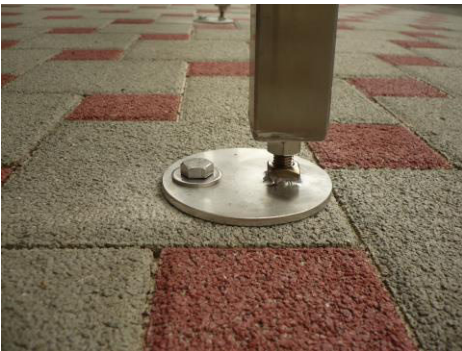
Variante I: unsichtbares Fundament

Zur sicheren Bodenbefestigung benötigen Sie vier Punktfundamente. Diese Fundamente können Sie selbst mit Fertigbeton aus dem Baumarkt oder z.B. mit Hilfe eines Garten- u. Landschaftsbauers anfertigen. Folgende Fundamentformen sind möglich (bitte Variante bei Bestellung angeben):