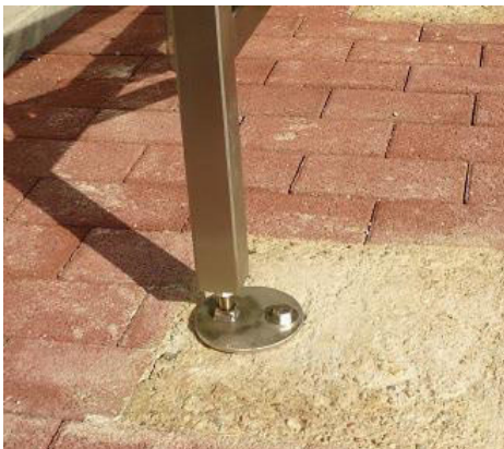
Variante II: sichtbares Fundament

Fundament befindet sich direkt unter der Pflasterung. Zwischen Pflastersteinen oder Bodenplatten und Fundament befindet sich kein Schotter, Kies etc. Die Steine sind direkt mit dem Betonfundament „verklebt“. Fundamente sind optisch nicht sichtbar.