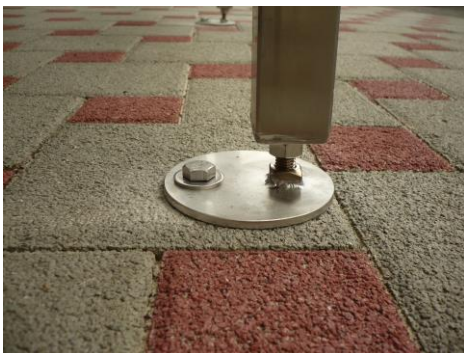
Variante I: unsichtbares Fundament

Zur sicheren Bodenbefestigung empfehlen wir vier Punktfundamente. Diese Fundamente können Sie selbst mit Fertigbeton aus dem Baumarkt oder z.B. mit Hilfe eines Garten- u. Landschaftsbauers anfertigen. Folgende Fundamentformen sind möglich (bitte Variante bei Bestellung angeben):