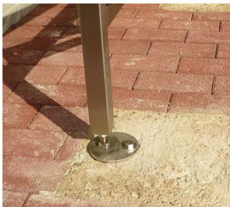
Variante II: sichtbares Fundament

Fundament befindet sich direkt unter der Pflasterung. Zwischen Pflastersteinen oder Bodenplatten und Fundament befindet sich kein Schotter, Kies etc. Die Steine sind direkt auf dem Fundament verlegt (möglichst keine Kies- und Sandschichten zwischen Fundament und Pflaster). Fundamente sind optisch nicht sichtbar.